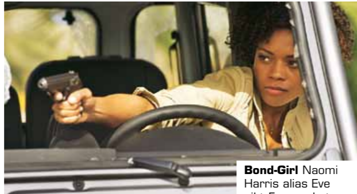
Bond-Girl Naomi Harris alias Eve gibt Feuerschutz