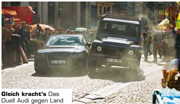
Gleich kracht's Das Duell Audi gegen Land Rover gewinnt der Brite