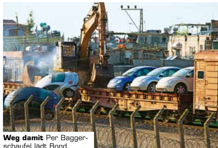
Weg damit Per Bagger-schaufel lädt Bond die Beetle vom Zug