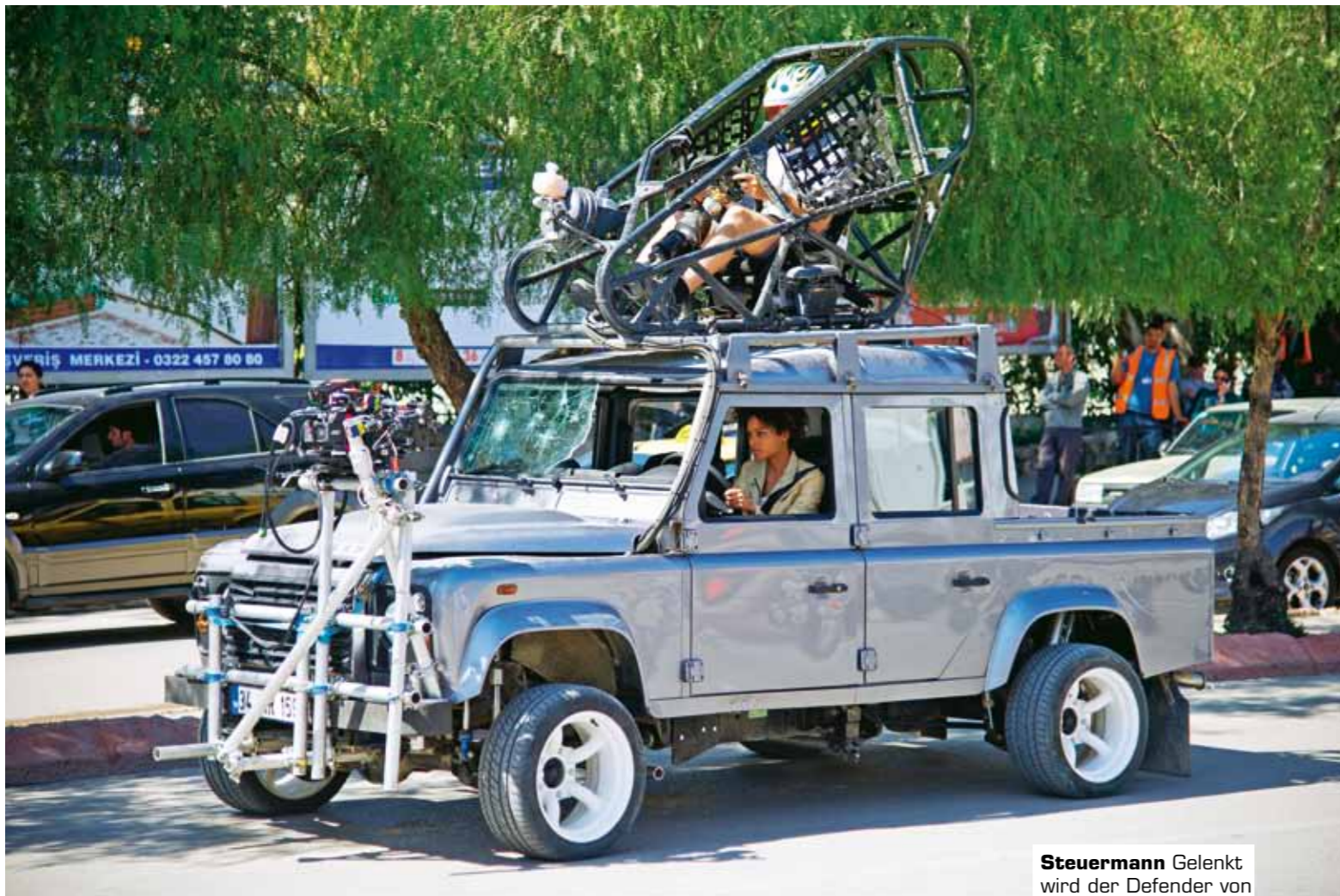
Steuermann Gelenkt wird der Defender von der ersten Etage aus