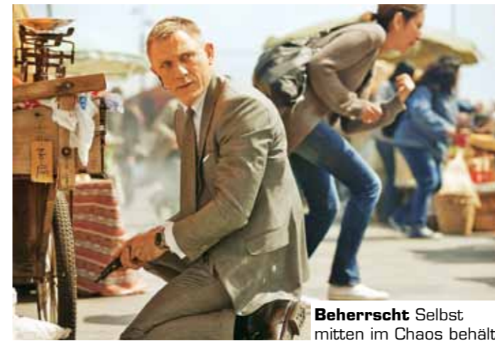
Beherrscht Selbst mitten im Chaos behält 007 stets den Überblick

Laut Gary Powell war es keine Absicht, dass in „Skyfall“ ausgerechnet Autos des Volkswagen-Konzerns für James Bond lustvoll zerstört werden (Audi, Beetle). Ob das wirklich Zufall ist? Den hochdotierten „Auto-deal“ mit den Produzenten machte diesmal nämlich nicht Aston Martin oder gar Volkswagen, sondern Jaguar/Land Rover. Der Autobauer stellte insgesamt 70 Fahrzeuge für den Einsatz vor und hinter den Kameras zur Verfügung. So wird Bonds Chefin „M“ in der Langversion des Jaguar-Flaggschiffs XJ durch Lon-