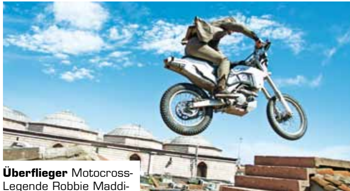
Überflieger Motocross-Legende Robbie Maddison doubelt hier Bond